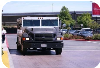
Società Trasporto Valori